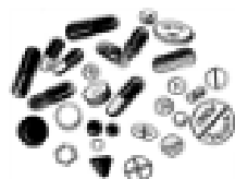
les cachets les comprimés